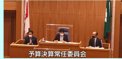
予算決算常任委員会

コロナ禍の中、皆様におかれましてはいかがお過ごしでしょうか。 令和4年度は予算決算常任委員会副委員長、医療保険子ども福祉病院常任委員会委員、都市計画審議会委員等を務めさせていただいております。引き続き県政と、ふるさと三重松阪の発展に誠心誠意取り組んでまいります。