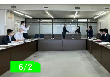
三重県社交飲食業生活衛生同業組合総会