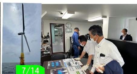
佐世保地方総監部視察（長崎県）