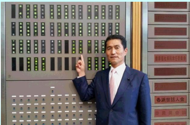
平成27年4月30日三重県議会初登庁

「初志貫徹」現場主義に徹し、県民の皆様への負託に応えられるよう頑張っておりますので、今後ともご指導ご鞭撻、よろしくお願い申し上げます。