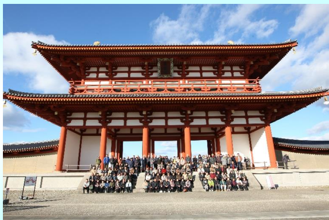
平成 28 年 12 月 11 日平城宮跡視察

三重県議会は平成 28 年 1 月 18 日に開会し、12 月 21 日に閉会しました。 三重県議会議員を拝命させていただいた 2 年目は、環境生活農林水産常任委員会と本年度新たに設置されました子どもの貧困対策調査特別委員会（副委員長）等に所属しております。 明日の三重県そして松阪市のために、「初志貫徹」現場主義に徹し、皆様のご期待に応えられるよう頑張つてまいりますので、今後ともご指導ご鞭撻、よろしくお願い申し上げます。