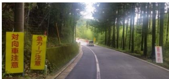
一般国道166号線（飯高町富永地内）

県内各地においても、166号線や松阪環状線のような、同様の事例は多くあるように思われる。まずは、安全対策を優先した、道路整備の促進をお願いしたい。