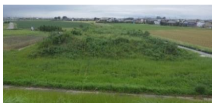
松阪環状線（東久保町地内）