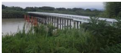
楯田川と大平橋（東久保町地内）