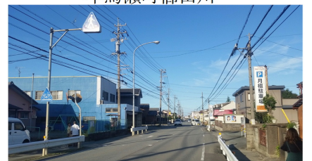
9/22 消えた横断歩道の調査 松阪市小黒田町地内