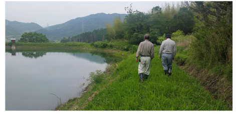
5/16 ため池の調査 松阪市御麻生菌町地内