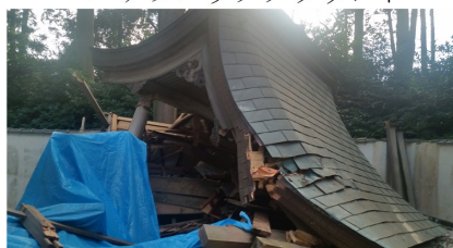
7/30 台風被害調査 松阪市美濃町地内