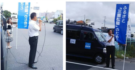
9/3 議員定数削減街頭演説活動 JR 松阪駅他