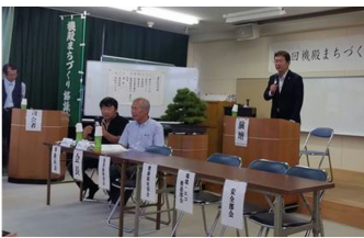
6/16 機殿まちづくり総会 機殿小学校多目的ホール