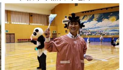
10/14 手をつなぐ育成会・親の会 ハートフル三雲