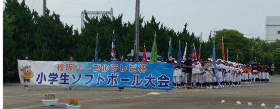
6/23 小学生ソフトボール大会 パナソニックグラウンド