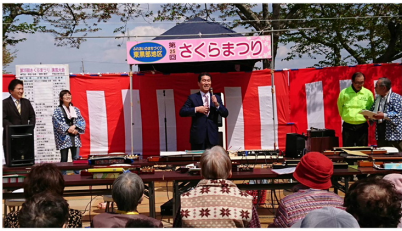
4/8 東黒部地区さくらまつり 二十五柱神社境内広場