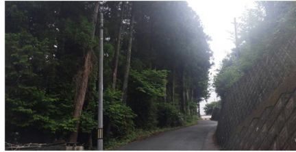
5/31 土砂災害特別警戒区域の調査 飯高町宮前地内