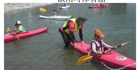
8/8 カヌー体験教室 早馬瀬町櫛田川