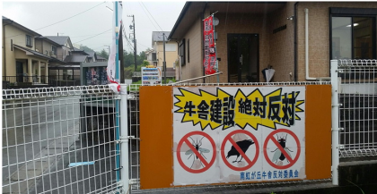
5/30 下蛸路町牛舎計画対策協議会 南虹ヶ丘町集会所