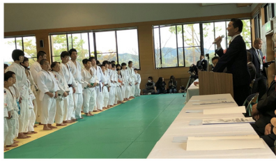
4/15 少年団交流柔道大会 オーシャン武道館