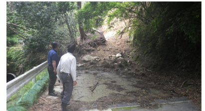
6/5 土砂崩壊現場の調査 松阪市勢津町地内