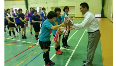
7/1 バレーボール大会 飯南町体育館