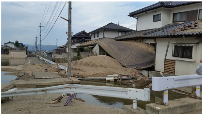
7/10-12 西日本豪雨ボランティア 岡山倉敷敷市真備町