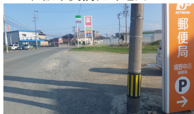
9/16 路面排水の要望箇所調査 嬉野町中川地内